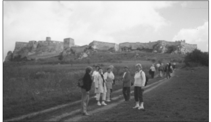
Cesta na Spišský hrad

v celej svojej kráse a mohutnosti. Prijemné, čisté prostredie, dobrá strava, tak môžeme charakterizovať naše miesto pobytu. Dies Domini - deň Pánov, nedeľa začala pre nás bohoslužbou v katedrále sv. Martina