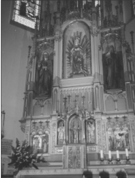
Hlavný oltár na Mariánskej hore

ných komplexov v strednej Európe. Aj keď strmý hradný kopec nedovolil všetkým účastníkom pozrieť si ho celý, tým kto-