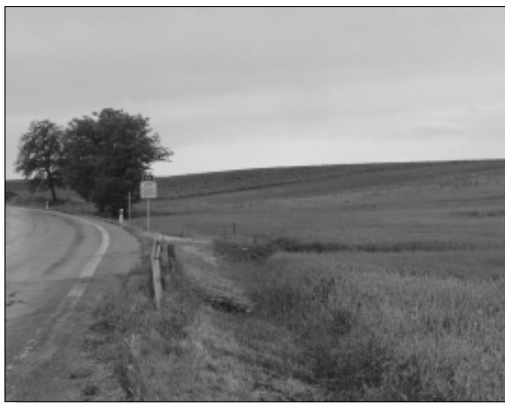
Pustáky od dediny

Dôvody, ktoré však viedli našich predkov pomenovať lokalitu názvom Červené vrchy sú nám dnes už neznáme. Snáď to bola červená farba pôdy, taká